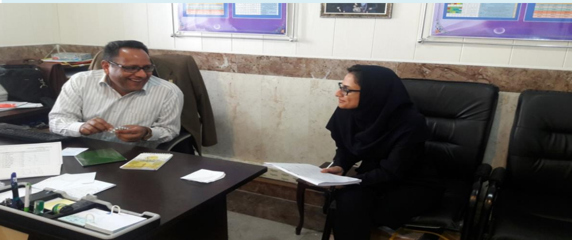
مراقبت از پرسنل معاونت بهداشت دانشگاه آبدان و توزیع قرص ویتامین D در هفته سلامت مردان