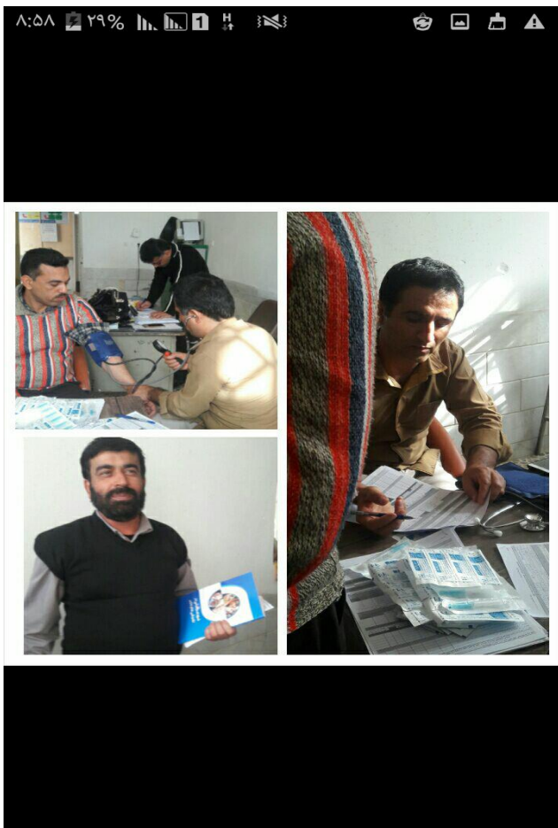
مراقبت از مردان در روستاهای آبادان