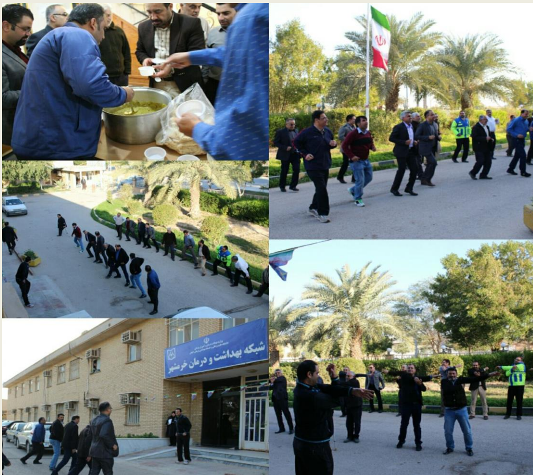
مسابقات ورزشی و صبحانه سالم به مناسبت هفته سلامت مردان در شبکه بهداشت و درمان خرمشهر