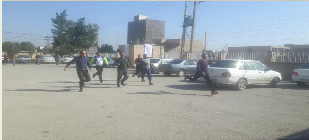
مسابقات ورزشی در شهرستان آبادان به مناسبت هفته سلامت مردان