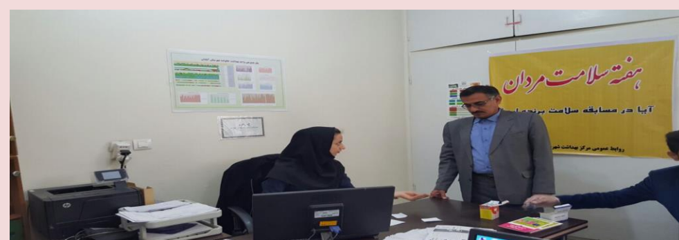
مراقبت از پرسنل مرکز بهداشت شهرستان شادگان و توزیع قرص ویتامین D در هفته سلامت مردان