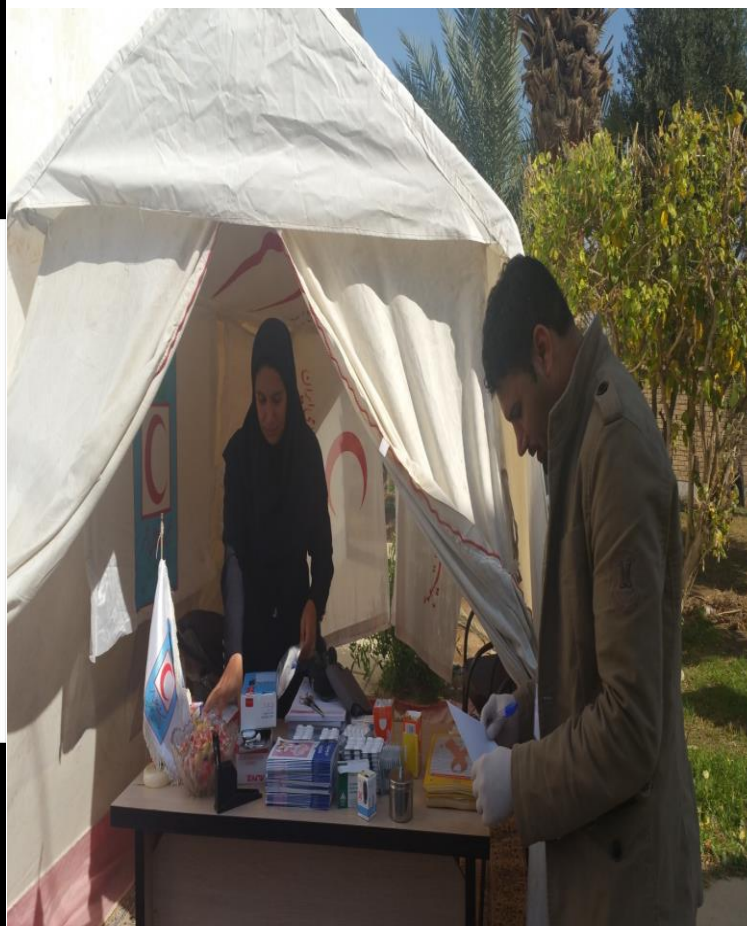
چادر سلامت در شهرستان خرمشهر