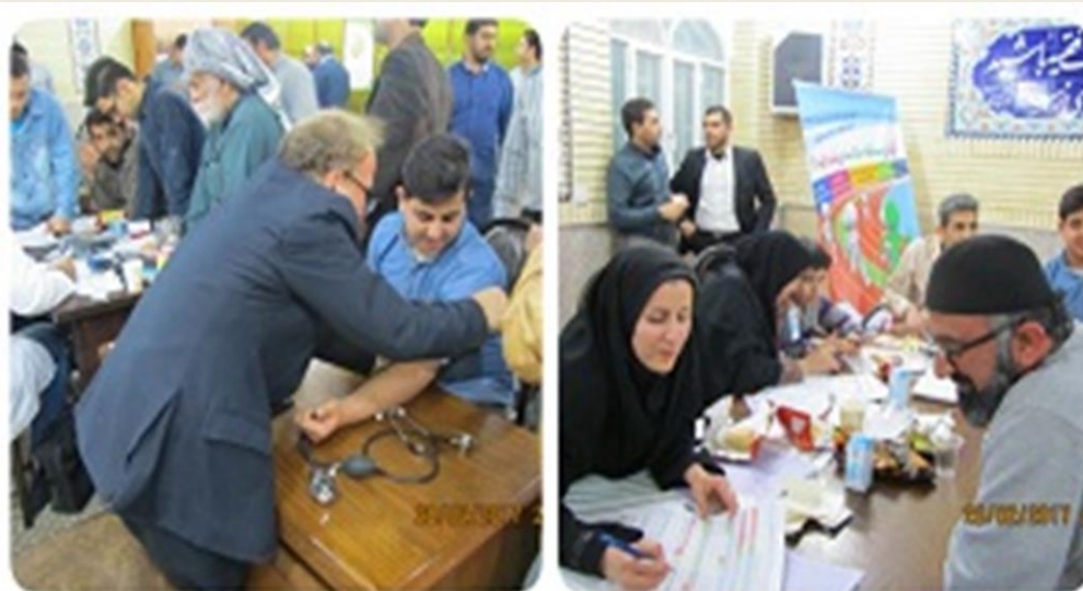
آموزش و مراقبت از مردان در هفته سلامت مردان در شهرستان شادگان