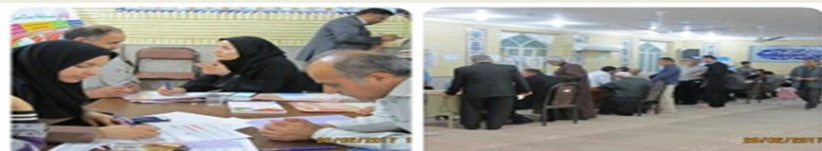
کمپین سلامت مردان در شهرستان شادگان