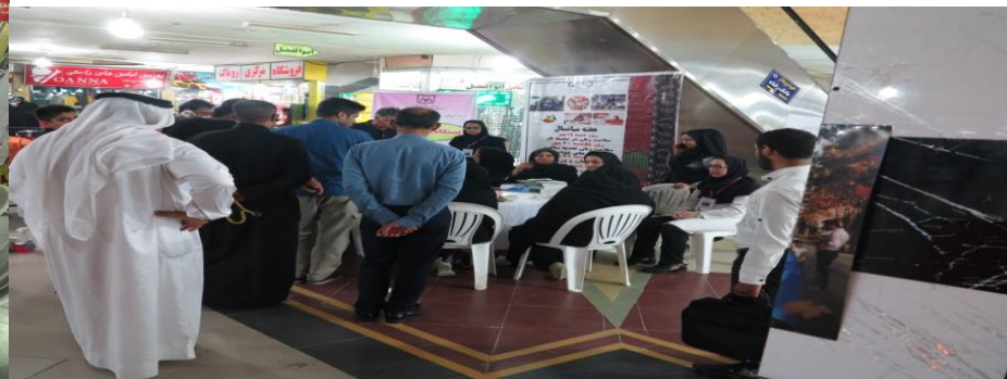
کمپین سلامت مردان در شهرستان آبادان