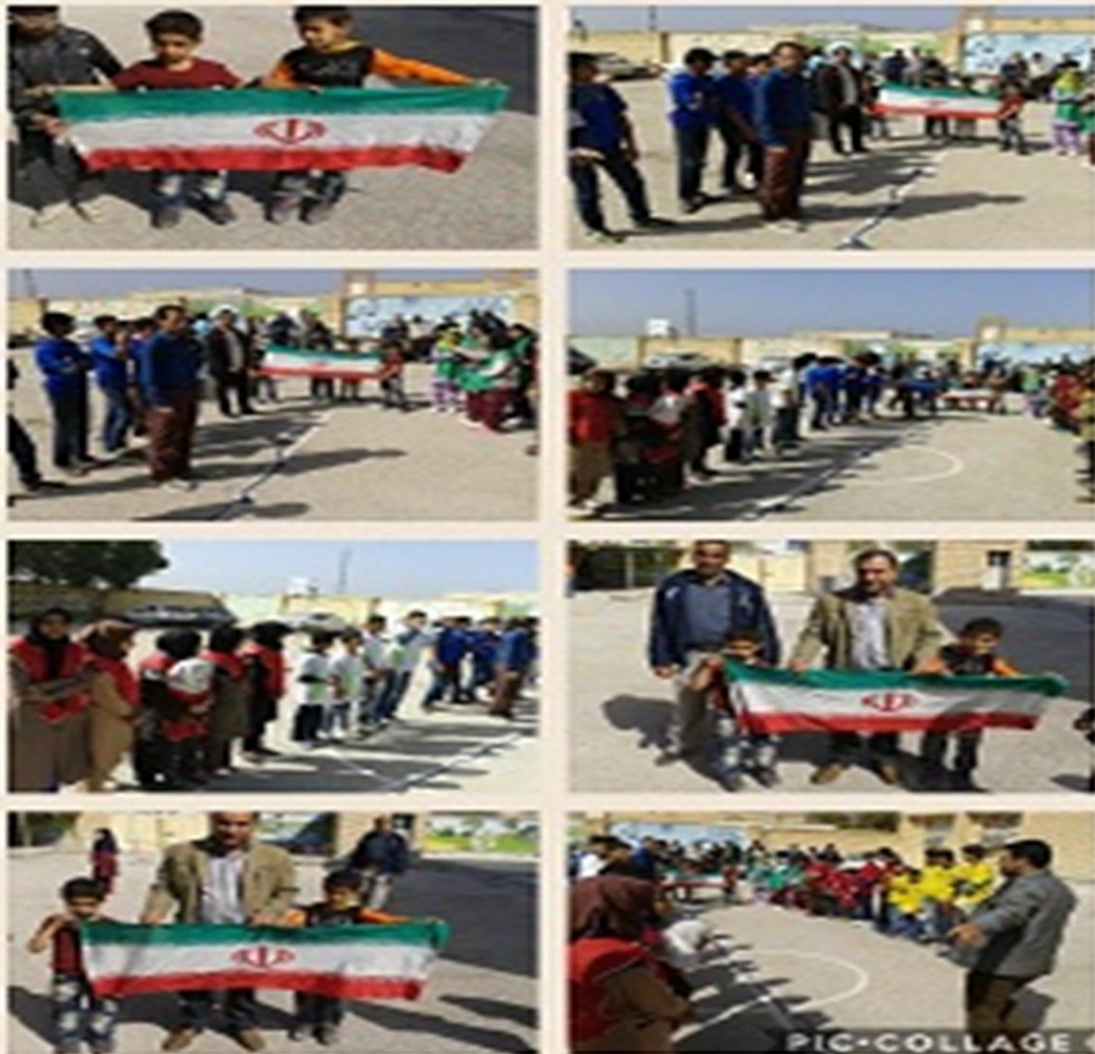
مسابقات ورزشی در شهرستان شادگان به مناسبت هفته سلامت مردان