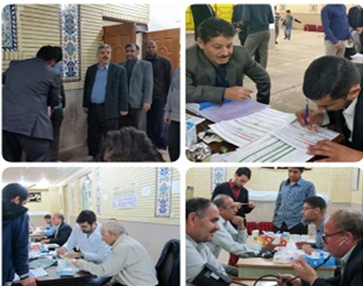
کمپین سلامت مردان در شهرستان شادگان