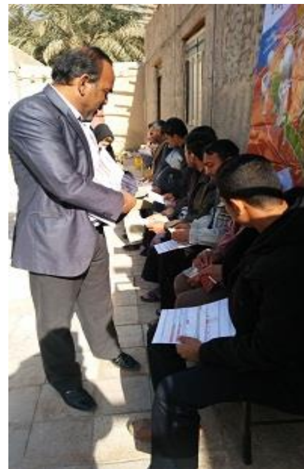
مراقبت از مردان در روستاهای شادگان